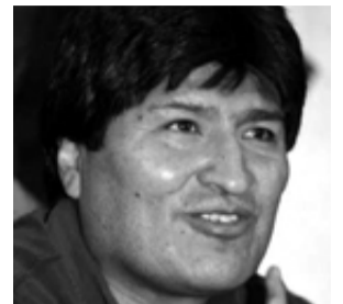
Evo Morales fou investit president de Bolívia el passat 22 de gener.