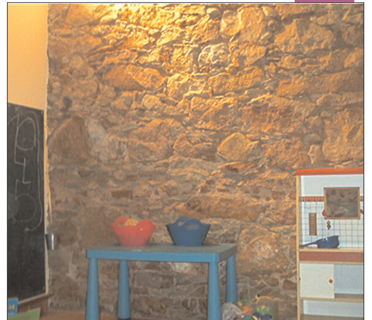
Espai per a petits de la teteria Malea.