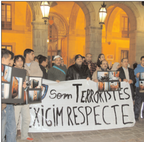
Concentració a Vilanova.

les situacions d'indefensió que genera; en aquests casos la seva impunitat es multiplica. Per una banda, per la gravetat de les acusacions que pesen sobre els detinguts, i per