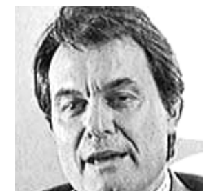
Mas pacta amb en Zapatero el nou estatut autonomista del Principat.