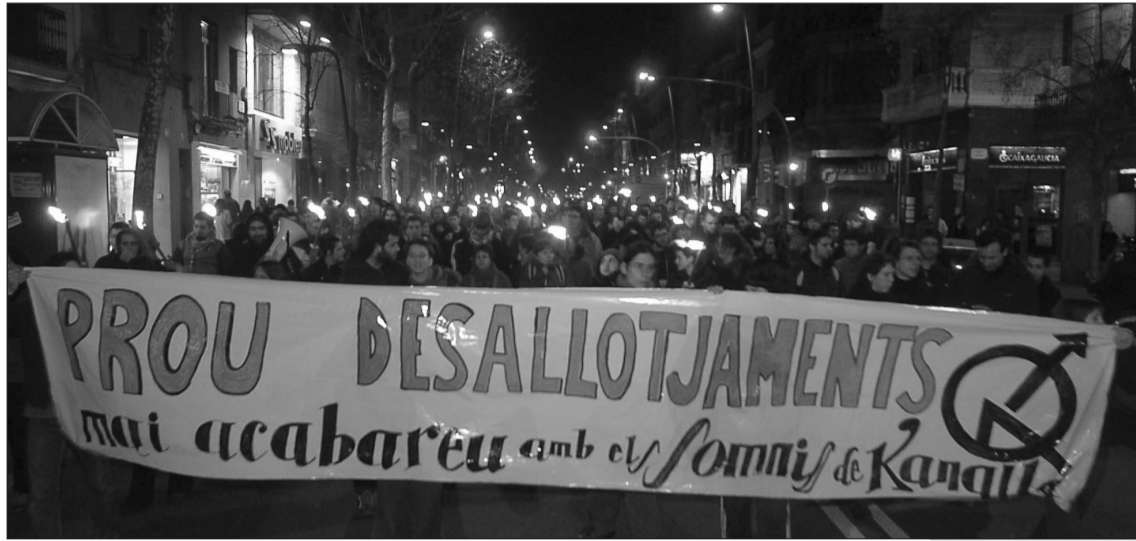
Una marxa de torxes recorre Sants després del desallotjament de La Quinkalla.

Unes 300 persones es van manifestar el dia 24 de gener al vespre pels carrers de Sants en protesta pel desallotjament de La Quinkalla. La marxa, que s'havia convocat a la plaça de Sants a les 20 hores, va partir il·luminada per desenes de torxes que donaven llum als freds i sordids carrers del barri. La manifesta-