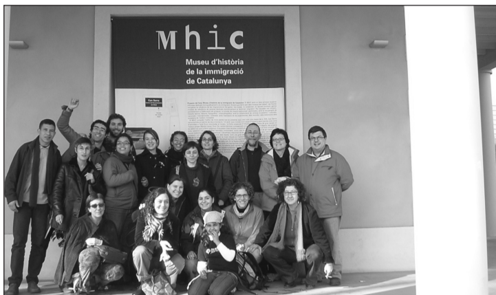
Participants de la sortida al Museu.

Les persones que van participar tant en el Punt d'Informació com donant suport a les tancades van creure que era necessari continuar treballant el tema de les migracions anant més enllà de la tasca legal d'informació sobre els drets de les persones immigrants i de les lluites que elles organitzen, aprofundint en el coneixement d'aquest fenomen històric, les seves raons i les seves conseqüències com una forma de conèixer i