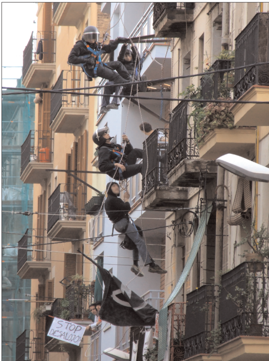
Es penjen per defensar la Quinkalla.