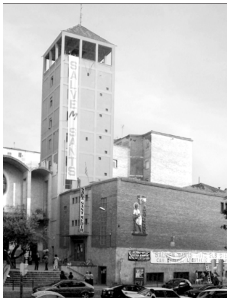
Mobilització veïnal per Can Batlló el mes de juny del 2005.

barri, les propostes d'equipaments que volen a Can Batlló. La llista és llarga: un pavelló i una pista poliesportiva, una piscina municipal, un centre d'acollida per a dones maltractades i un per a persones sense sostre, un equipament d'atenció per a immigrants, un centre de serveis socials i de planificació familiar, també una sala d'exposicions i de concerts, una nova biblioteca-sala d'estudis i una escola d'adults, un gran aparcament públic, reserva per a residències de gent gran i nous centres de dia. En l'àmbit social, un casal de barri-centre cívic, amb espais per a joves i per a entitats i amb un model de gestió adaptat a les necessitats d'aquests col·lectius. Pel que fa a equipaments de centralitat , els veïns proposen fer-hi la Biblioteca Central de la ciutat (la del Born), una escola d'oficis i un centre de documentació dels moviments socials de Barcelona. Aquest darrer equipament pretén mantenir el tarannà d'un barri que ha vist néixer les Comissions Obreres i la refundació de la CNT.