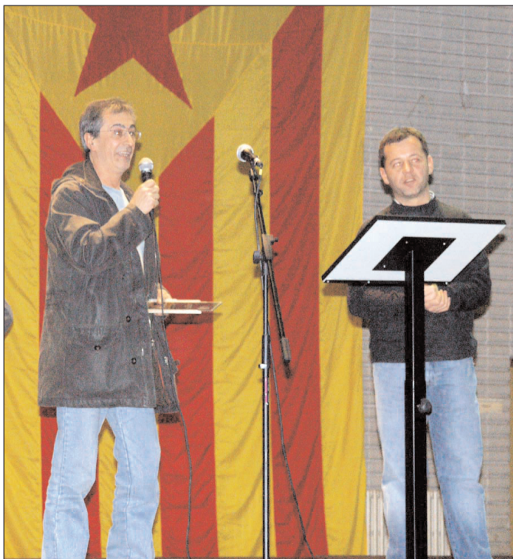
Moment de l'homenatge del Casal a les entitats del barri.