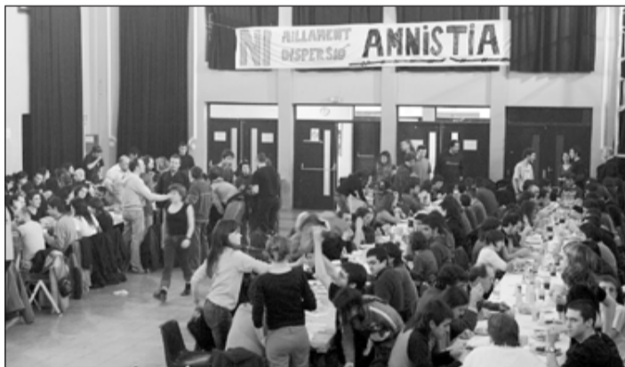
Gustós sopar de l'aniversari de Rescat.