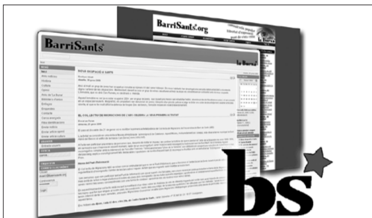
Els portals de BarriSants.org.