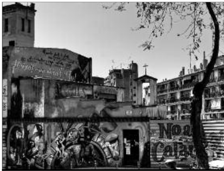
Façana del centre social.

El 16 de desembre es va celebrar la primera Assemblea de la Plataforma de suport a Can Vies.