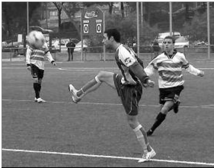
La Bàscula és un dels camps al qual s'hi va instal·lar gespa artificial.

Els presidents de més d'una desena d'entitats esportives de Sants-Montjuïc s'uneixen per reivindicar uns preus més econòmics per als camps de futbol.