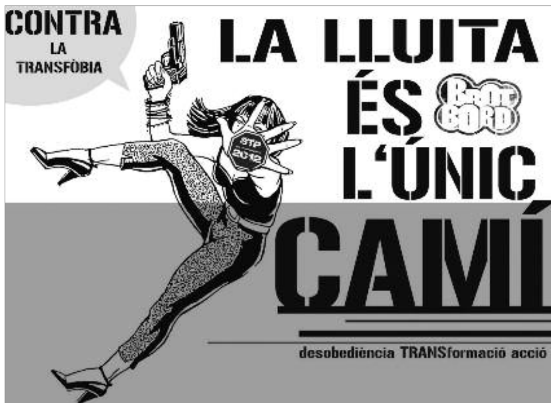
Un dels cartells del col·lectiu Brot Bord.

En una de les seccions fixes, s'explica el perquè de la paraula bord . Sota el nom de la Tieta, s'amaga una apassionada de la llengua que ha creat un taller sobre argot bord, i en el qual es pot participar a través de http://argotbord.blogspot.com . Comencem pel principi. La paraula bord és la traducció en català de la paraula anglesa queer , que significa estrany, desviat i improductiu. L'accepció més emprada de la paraula bord es refereix al regne vegetal. Quan es parla d'un arbre erm, parlem d'un arbre que no pot donar fruits o que els que dona no són bons. La paraula també és aplicable a animals, persones o situacions. En aquest cas, es va trobar aquesta pa-