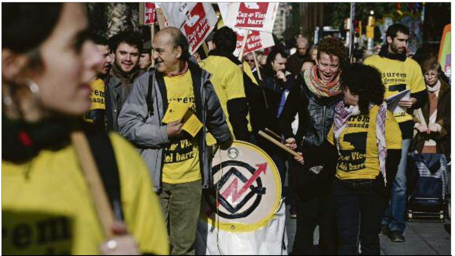
Cercavila contra la demanda de desallotjament del Centre Social Autogestionat Can Vies. ALBERT GARCIA

El Centre Social Autogestionat Can Vies, amb més de 13 anys d'història, seu d'incomptables activitats i iniciatives i amb