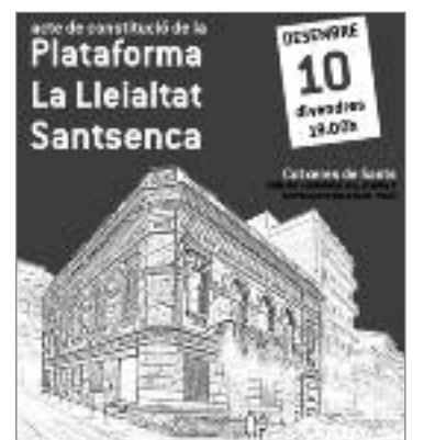
Cartell de la constitució de la Plataforma.