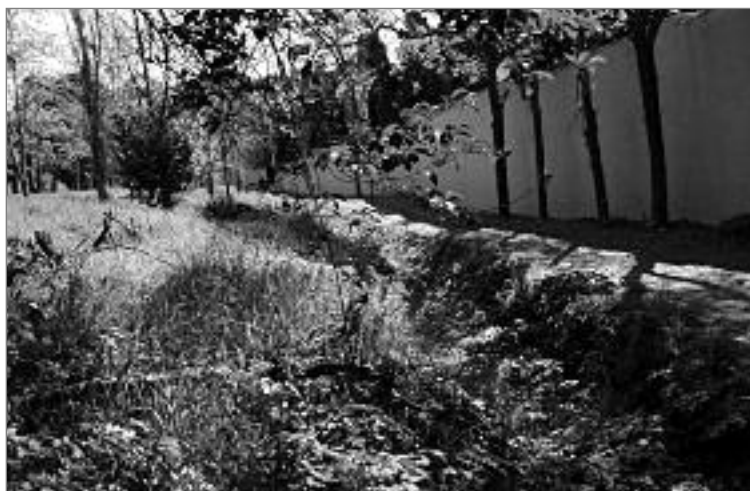
Imatge del lloc on es vol ubicar la gossera dins del parc. AV LA SATÀLIA

Consideren que la construcció de la gossera, a més de fer perdre zona