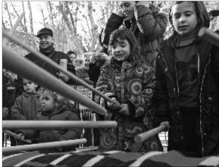
Les criatures es van endur les llaminadures que els va cagar el Tió.