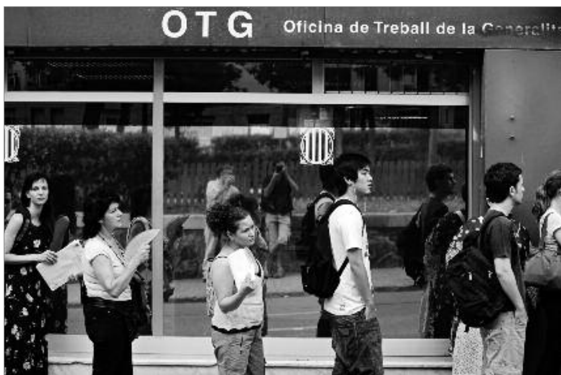
Oficina de Treball de la Generalitat que hi havia a la Plaça de la Farga, fou tancada el març del 2009 i actualment encara està ubicada a l'Estació del Nord. No hi ha informació sobre l'obertura d'una nova seu al barri, ja que segons fonts del Departament de Treball, no troben cap espai prou gran.

Augment dels desnonaments, retallades i congelació de les pensions, eliminació del subsidi d'atur de 426 euros, tancaments d'empreses i precarietat laboral són realitats que afecten moltes persones del barri.