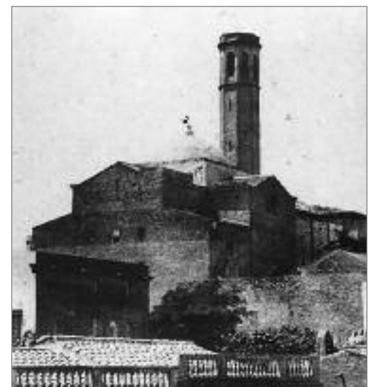
Església de Santa Maria de Sants a finals del segle XIX.