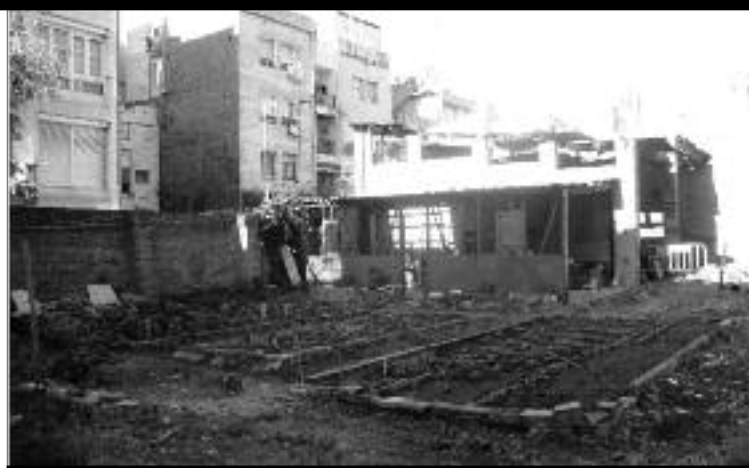
L'hort urbà del carrer Noguera Pallaresa. JOAN VILLAGRASA

Al carrer Noguera Pallaresa, 27, en una illa interior entre Rossend Arús i Olzinelles, trobem l'hort urbà de la Farga, una iniciativa autogestionada i destinada a l'agricultura ecològica.