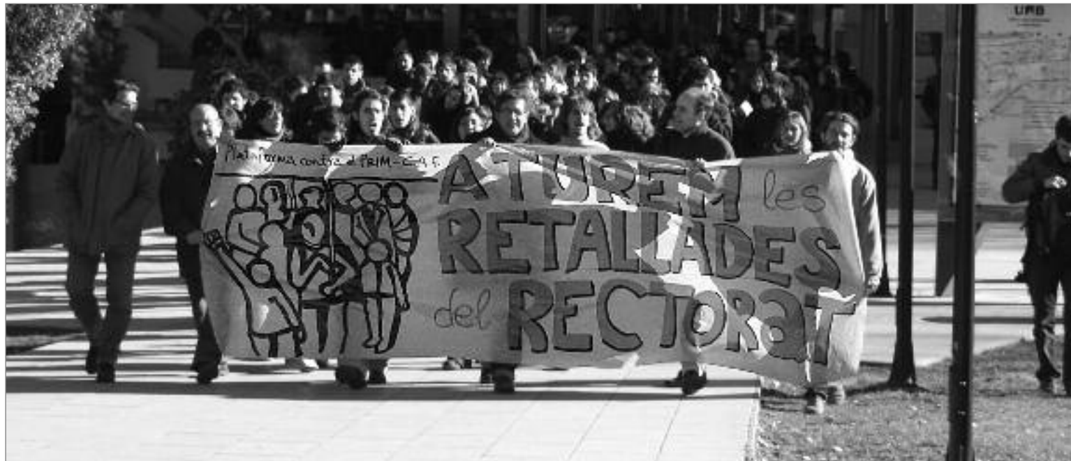
A la mateixa hora que es celebrava el claustre, unes 200 persones es manifestaren pel campus de la UAB en contra de les retallades. MARC MIRAS

immediat, de les problemàtiques actuals, tant socials com ecològiques i econòmiques, i dels moviments populars que ens fan avançar.